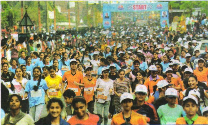
ನಿಟ್ಟೆ ಮಂಗಳೂರು ಹಾಫ್ ಮ್ಯಾರಥಾನ್ ವಿಜೇತರ ವಿವರ