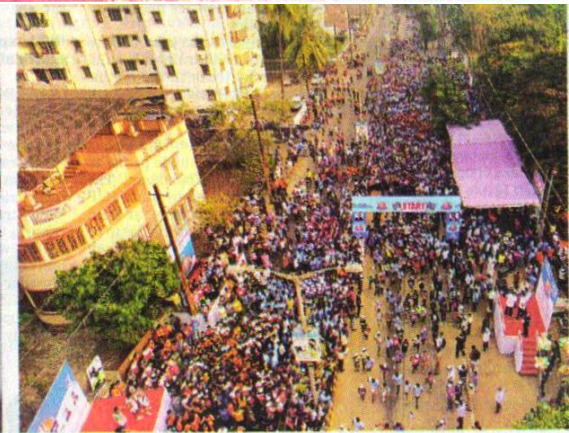
A total of 15,000 people participated in the Nitte-Mangaluru half-marathon on Sunday. The event was organised by the Nitte Group of Institutions. This is the first time in the last 10 years that such a large number of participants turned up for such an event in the city